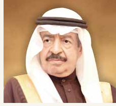
سمو رئيس الوزراء

حمد آل خليفة، وبقوات تهنئة إلى رئيس جمهورية أفغانستان الإسلامية محمد أشرف غني، بمناسبة ذكرى استقلال بلاده.