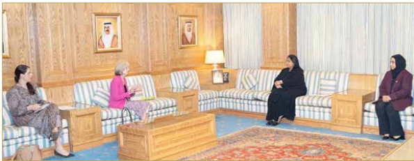
الشيخة رنا بنت عيسى تستقبل القائم بأعمال سفارة الولايات المتحدة الأمريكية

◆ رنا بنت عيسى: البحرين أصبحت في فترة وجيزة بيت خبرة بشؤون المرأة