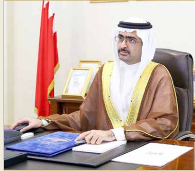
التمامة - وزارة الداخلية

ترأس محافظ الجنوبية سمو الشيخ خليفة بن علي بن خليفة آل خليفة، اجتماع المجلس التنسيقي الحادي عشر (عن بعد) عبر تقنية الاتصال المرئي، بحضور عدد من الأعضاء من ممثلي الجهات المختلفة.