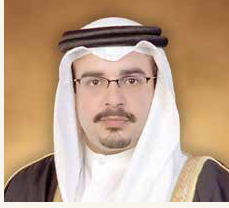
سمو ولي العهد

حمد آل خليفة، وبقوات تهنئة إلى رئيس جمهورية أفغانستان الإسلامية محمد أشرف غني، بمناسبة ذكرى استقلال بلاده.