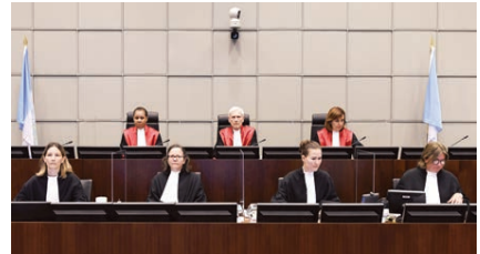
○ هيئة المحكمة الدولية الخاصة بليبنان خلال جلسة الطلق بالحكم في قضية اغتيال رفيق الحريري.

لايستنداء (هولندا) - الوكالات: أدانت المحكمة الدولية الخاصة بليبنان أمس ولحدا من المتهمين الأربعة الأضواء في حزب الله في قضية اغتيال رئيس الوزراء اللبناني الأسبق رفيق الحريري عام ٢٠٠٥، الذي طبع بدعاياته الكبيرة تاريخ لبنان الحديث. وقال رئيس المحكمة القاضي ديفيد راي في ختام حكم الاستعرف ثلاثه ساعات: «تعلن بمرءى ليهه التنبه التنبه بصفته شريكاً في ارتكاب عمل إرهابي باستخداو مادة متفجرة، وقتل رفيق الحريري عمداً، وقتل ٢١ شخصاً غيره، وسحاولة قتل ٢٢٦ شخصاً، هم الجرحى الذين أصابوا في الاغتيال المروع الذي وقع في ١٤ فبراير ٢٠٠٥. وأضاف القاضي أن المتهمين الأربعة حسن حبيب