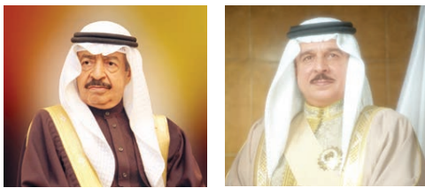
○ سمو رئيس الوزراء. ○ جلالة الملك.